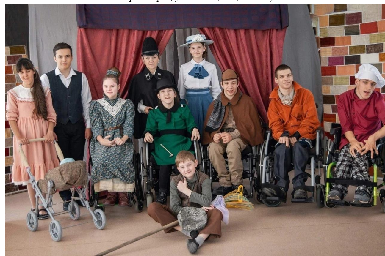
Участники инклюзивного театра «Конфетти» на сцене КГБУ СО «Радуга» (г. Красноярск, ул. Воронова, д. 19а, 2023 г.)