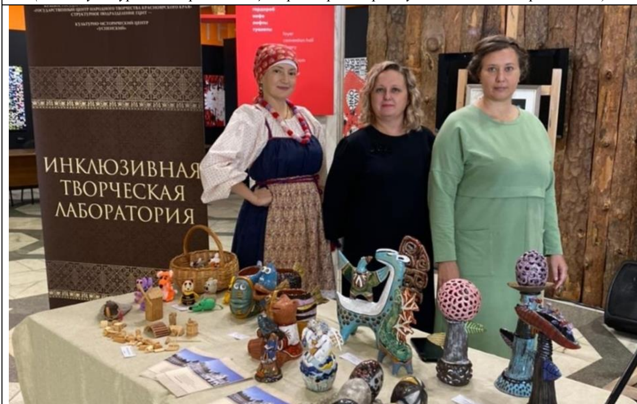
Презентация ИТЛ на Форуме инклюзивных технологий в Музейном центре «Площадь Мира» (г. Красноярск, пр. Мира, д. 1, 2022 г.)