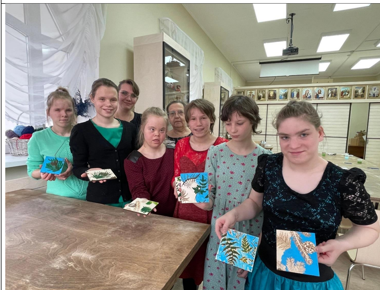
Мастер-класс в рамках проекта «Добро» для пациентов психоневрологического интерната (ИТЛ, Культурно-исторический центр, г. Красноярск, ул. Лесная 55а, стр.3, 2022 г.)