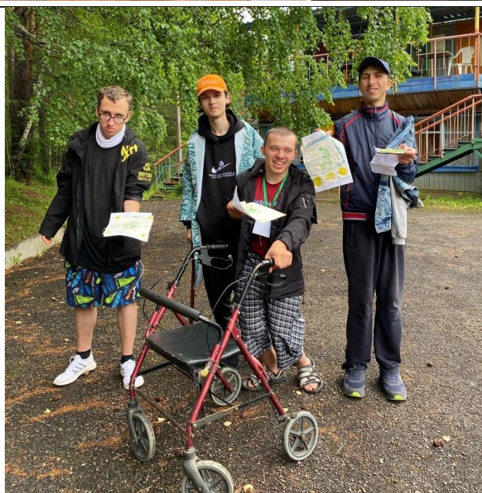
Выездные мастер-классы ИТЛ в рамках проекта «Добро» для детей с ОВЗ инклюзивной смены «Трудово» (СОК «Зелёные горки», Манский район, пос. Правый, 2023 г.)