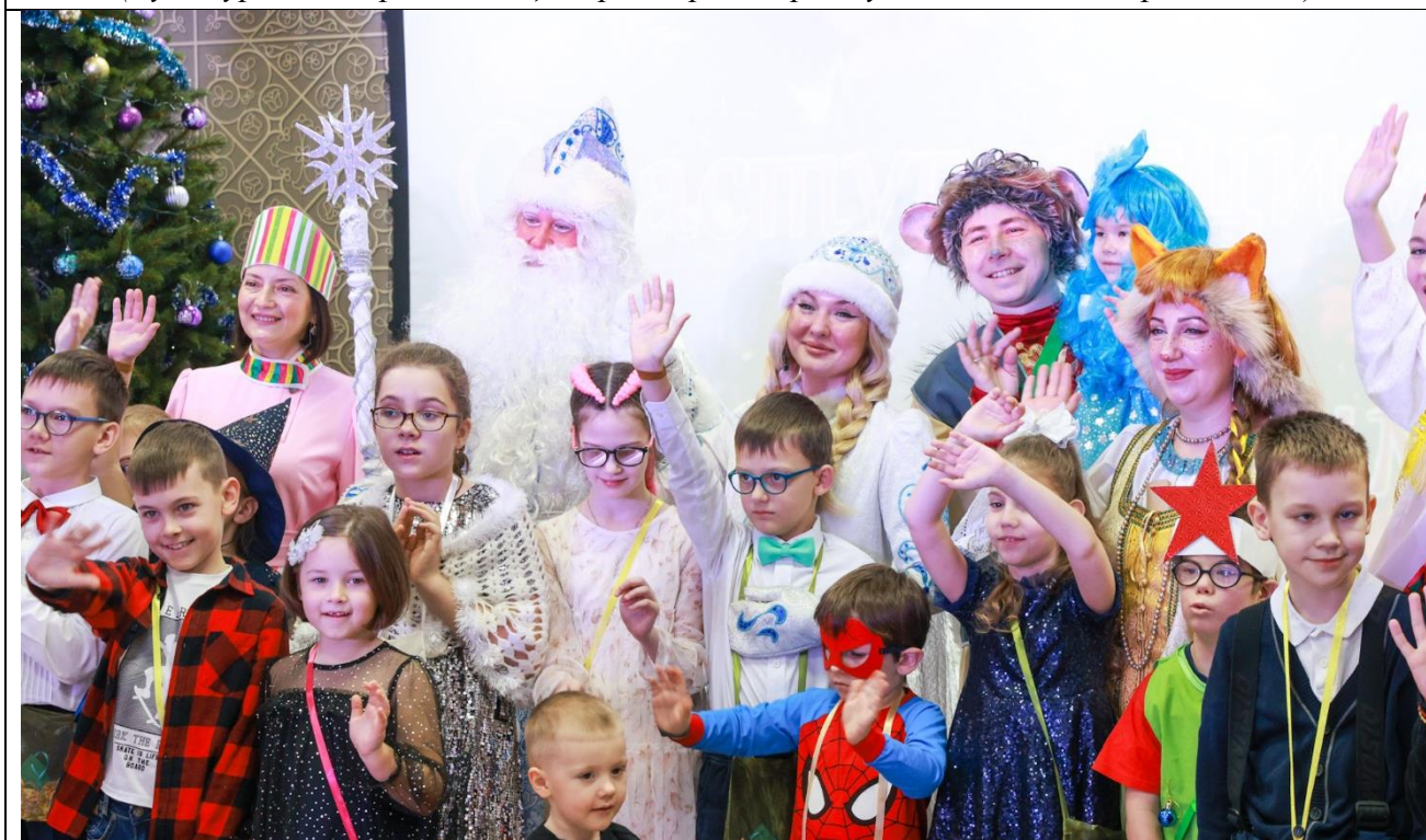
Новогоднее представление для слабовидящих учащихся КГБОУ «Красноярская школа № 1» (Культурно-исторический центр, г. Красноярск, ул. Лесная 55а, стр.3, 2022 г.)