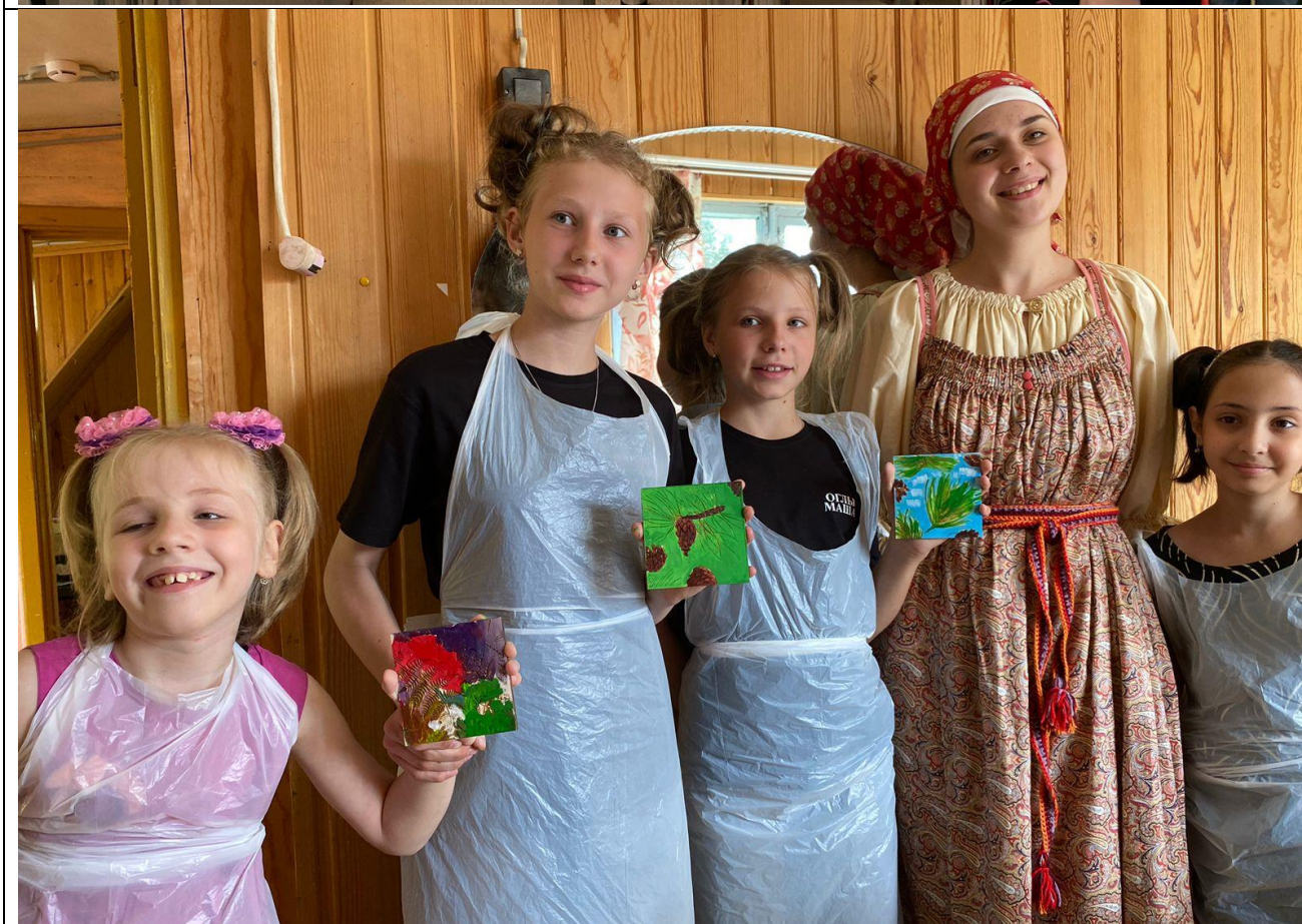
Выездные мастер-классы ИТЛ в рамках проекта «Добро» для детей с ОВЗ инклюзивной смены «Трудово» (СОК «Зелёные горки», Манский район, пос. Правый, 2023 г.)