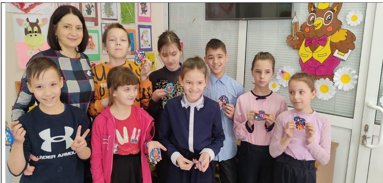
Выездной мастер-класс в рамках проекта «Добро» для пациентов КГБУЗ «Красноярский краевой противотуберкулезный диспансер №1» (Краевой детский противотуберкулезный санаторий «Пионерская речка», Красноярск, ул. Лесная, 425, 2023 г.)