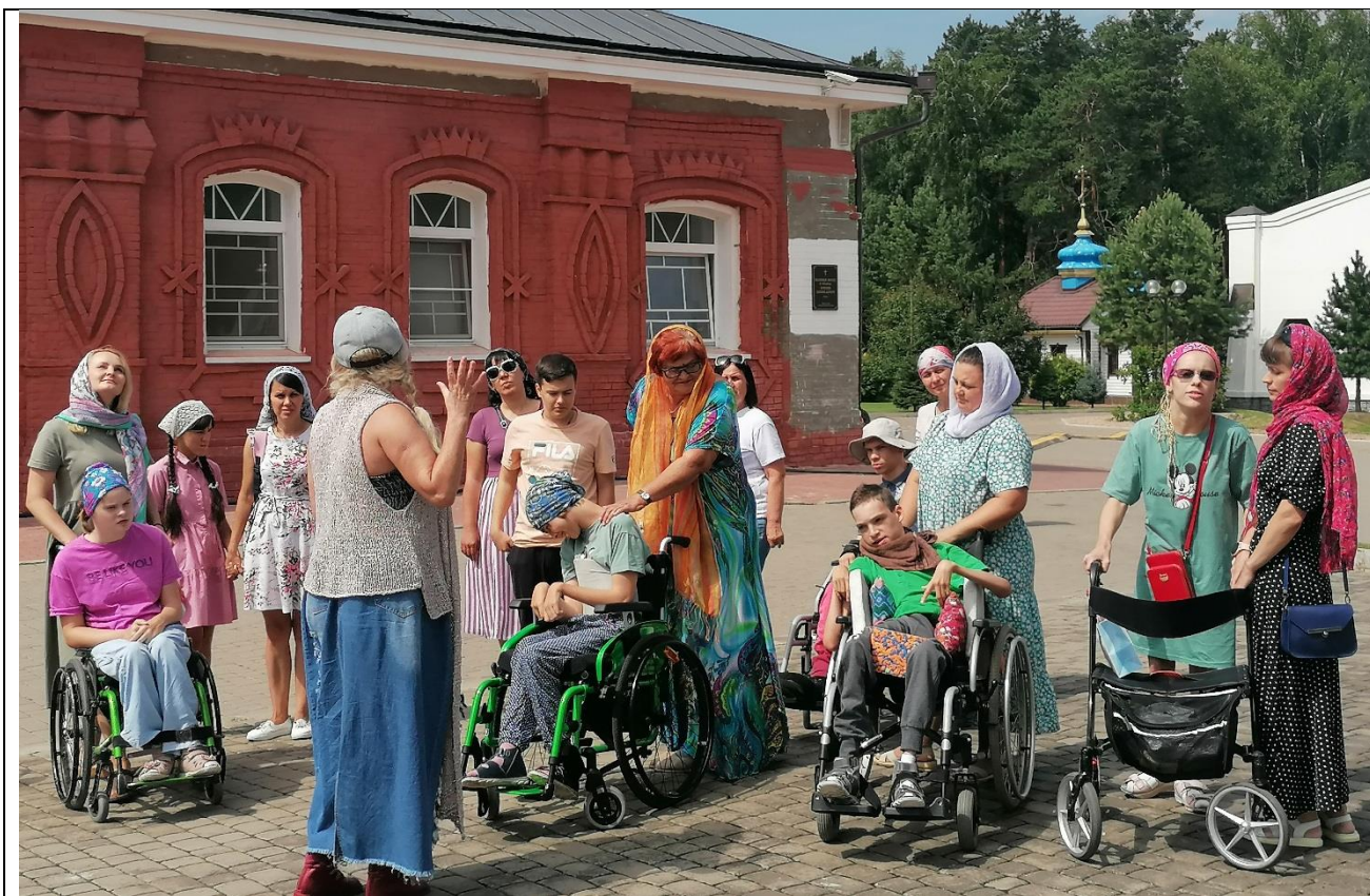
Познавательная программа для участников инклюзивного театра «Конфетти» (Культурно-исторический центр, монастырский комплекс, г. Красноярск, ул. Лесная, 55а, 2023 г.)