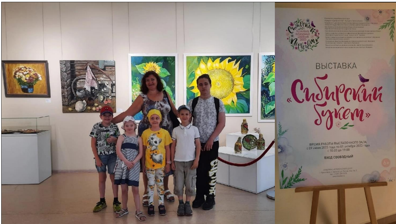
Подопечные КГБУ СО «Центр социальной помощи семье и детям «Надежда» на выставке краевого праздника цветов «Сибирский первоцвет» (Культурно-исторический центр, г. Красноярск, ул. Лесная 55а, стр.3, 2022 г.)