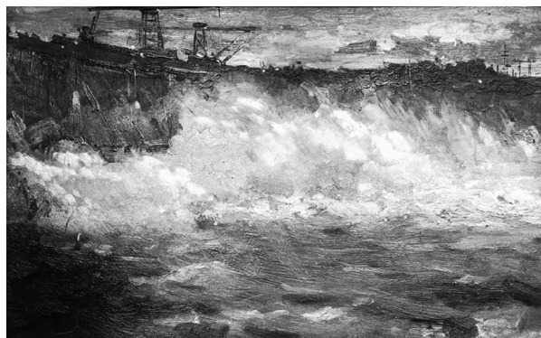
Рис. 1. В. И. Бочанцев, Братская ГЭС, 1963 [2]

Как видим, выводы, касающиеся двух представленных работ, совпадают. Это стало возможным потому, что объектом изображения является одно историческое событие и сооружение, обе картины («Братская ГЭС, 1958 год» и «Братская ГЭС, 1963») были созданы в рамках одного периода в истории страны. Однако чтобы оценить своеобразие и колорит пейзажной живописи представленных работ, необходимо провести более подробный сравнительный анализ, позиции которого не вполне вписываются в концепцию историко-культурного подхода, но могут существенно дополнить и расширить критерии оценки.