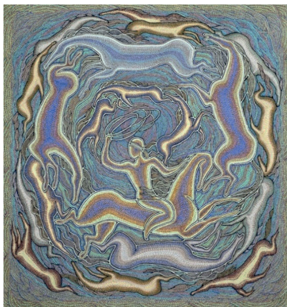
Рис. 5. Мухамеджан З. Небесный жених. 2017. Сукно, шелковые и хлопчатобумажные нити. 73 × 70.

Каждый стежок и сам колорит данной текстильной картины направлен на визуальное воссоздание сакрального момента — вступления шамана в связь с высшими силами.