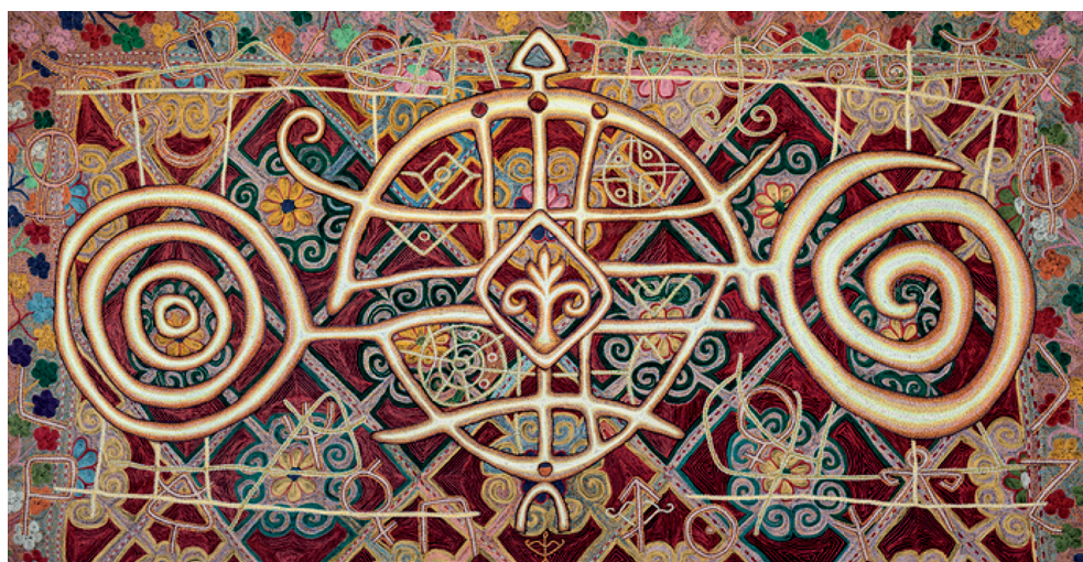
Рис. 6. Мухамеджан З. Знаки Степи. Три жуза. 2014. Сукно, шелковые нити. 200 × 100

Произведение, выражая в целом философию взаимосвязанности бытия-небытия, словно пронизано дыханием вечности [16, 23]. Явную небесную символику, подчеркнутую колоритом и сюжетом картины, мы видим в другой работе З. Мухамеджана, «Небесный жених» (рис. 5). Выполненное в единой колористической гамме, в сочета-