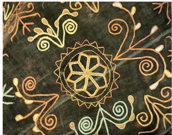
Рис. 3. Фрагмент женского свадебного халата из коллекции РЭМ. № 3378-68.