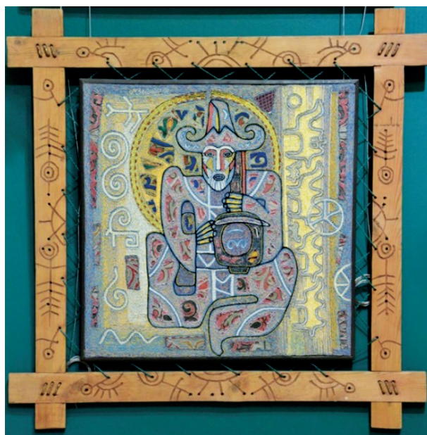
Рис. 4. Мухамеджан З. Коркыт-Ага. 1999. Х/б ткань, шелковые нити. ГМИ РК им. А. Кастеева

и инструмента усиливается подчеркнутым силуэтом из крупных стежков, сливающихся плоскостное изображение в единое целое» [12, 35]. Весь фон картины заполнен знаками: спирали и другие солярные символы, волны, стилизованная птица, муфлон и др.