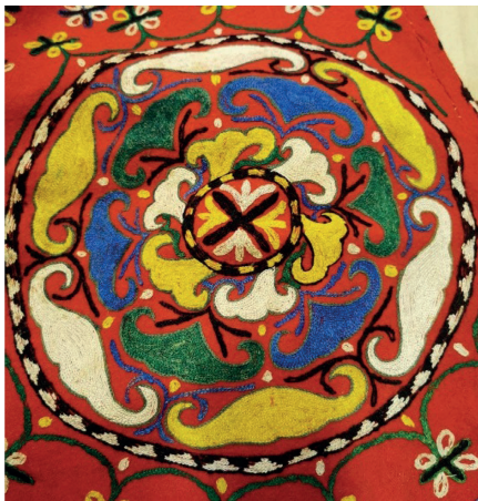
Рис. 2. Фрагмент женского свадебного халата из коллекции РЭМ. № 33-45.

автор статьи во время исследования фондов РЭМ ознакомилась с образцами традиционной казахской вышивки — вышитых тамбурным швом женских свадебных халатов (рис. 2 № 33-45 и рис. 3 № 3378-68) из Туркестанской и Восточно-Казахстанской областей. Подобные образцы из казахстанских фондов нам неизвестны [18, 1665]. В целом изображение солнца и его производных воспринималось как субстанция, очищающая от негативного и одновременно способствующая плодородию, процветанию и благополучию.