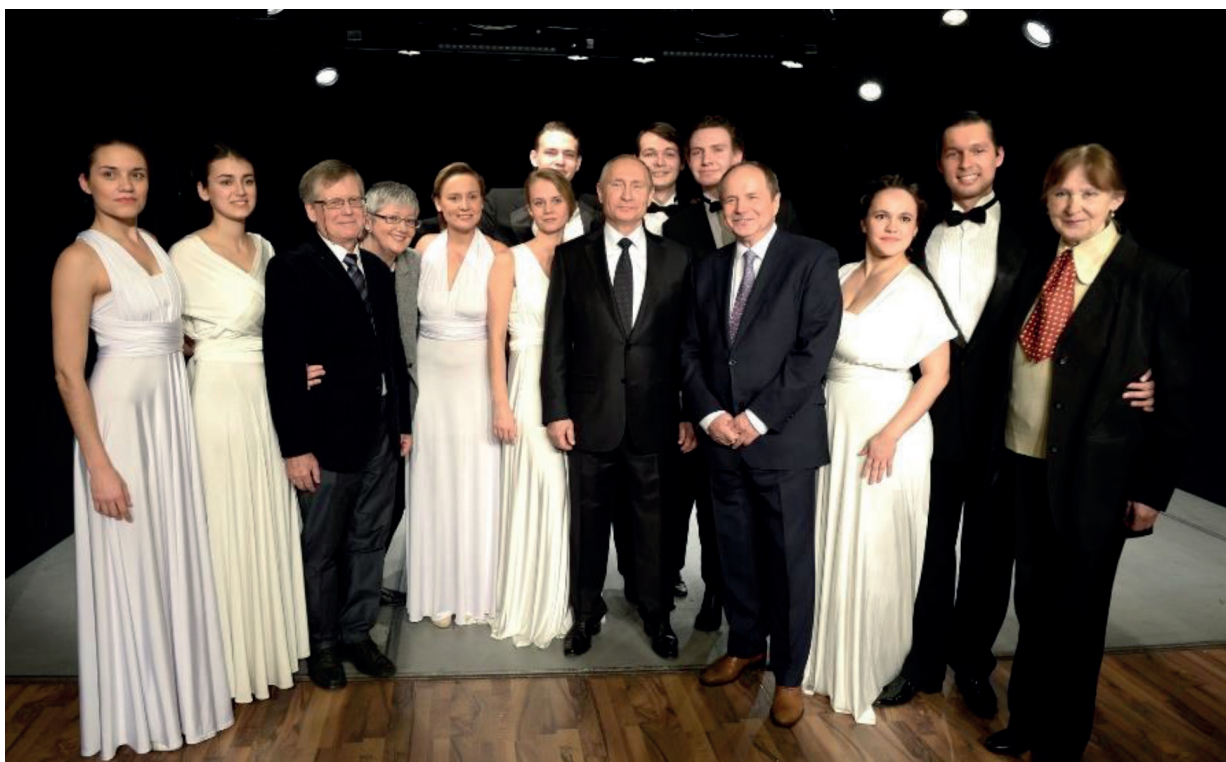
Президент Российской Федерации В. В. Путин в Российской государственной специализированной академии искусств. 5 декабря 2017 года

В этом выпуске мы предлагаем вниманию читателей историю развития и становления РГСАИ сквозь призму большой работы его основателей, руководства и преподавателей, успехов студентов и выпускников, достижений факультетов, кафедр и иных подразделений вуза. Мы постараемся рассказать о тех, кто помогает студентам с особенностями здоровья и без таковых получить полноценное и высококонкурентное высшее образование в сфере культуры и искусств, а затем добиться успешной профессиональной реализации.