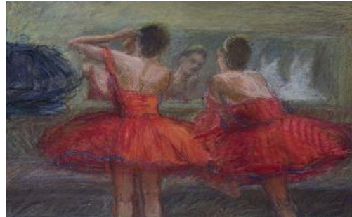
Е. Рассадникова. Последние штрихи. Бумага, пастель, 42x55, 2014 год

Представляем несколько работ выпускников факультета изобразительного искусства.