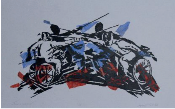
Н. С. Ларчуженков. Бой с тенью. Линогравюра, коллаж, 60x40, 2012 год

работа, выполненная в техники линогравюры, была посвящена параолимпийскому спорту. Часть картин проекта и сейчас украшают стены РГСАИ.