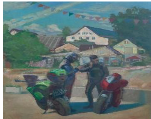
А. В. Абраменкова. Мотоциклисты. Холст, масло, 100×90, 2021 год