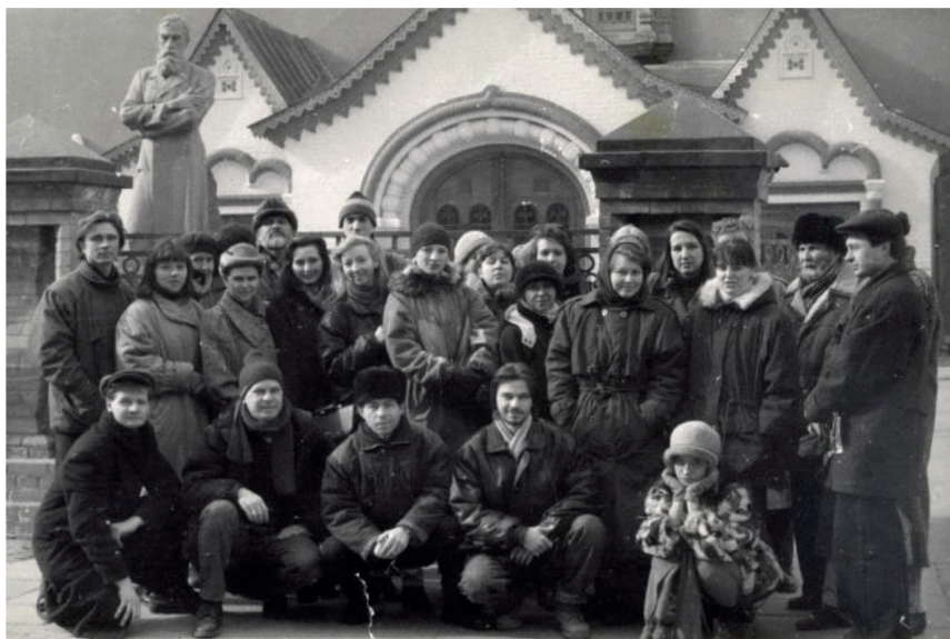
Экскурсия в Третьяковскую галерею студентов и преподавателей факультета изобразительного искусства (1993)