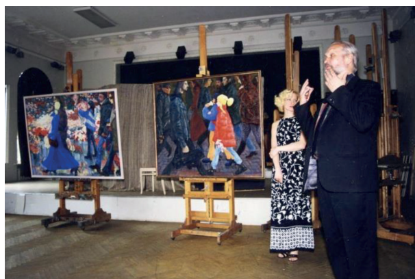
Защита дипломных работ на факультете изобразительного искусства, 1998 год.