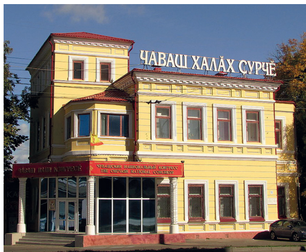
Рис. 4. Чувашский национальный конгресс. Чебоксары

пластическую выразительность. Декоративные пояски из филенок горизонтально членили фасады здания. Главный двухэтажный объем был декорирован горизонтальными штробами, выделенными цветом. С главной стороны здания парапет был украшен декоративным аттиком и вазонами. Прямоугольные наличники обрамляют большие окна. Венчают здание профилированные карнизы с прямоугольными выступами. Окна подвала выходят на уровне цоколя с северной стороны. Автор этого проекта, по мнению исследователей, также казанский архитектор К. С. Олешкевич [9, 32]. Здание в основном сохранило первоначальный вид, однако изменилась исходная планировка: в 1960 году были снесены декоративные элементы парапета и вазоны. На месте главного входа был сооружен тамбур. Интерьеры и внутреннее убранство помещений не сохранились. В здании размещались государственные организации, детский дом, дворец бракосочетания. Сегодня здесь расположена общественная организация «Чувашский национальный конгресс» (рис. 4).