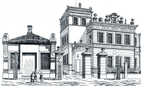
Рис. 3. Иванов Е. И. Особняк Николая Ефремова. Чебоксары. 1952 год

Главный и служебные входы располагались в трехгранном объеме, соединяющем два других. Двухэтажный объем, прямоугольный в плане, с западной стороны соединялся с трехэтажным параллелепипедом, а с восточной — с криволинейным в плане двухэтажным объемом. Соединенные в один объем различные формы придают фасадам здания