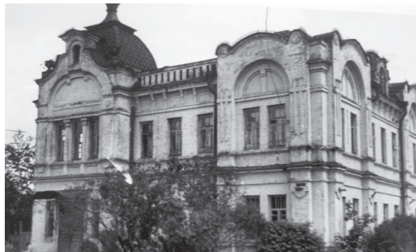
Рис. 5. Дом Бурашникова. Ядрин. 1965 год

По некоторым данным, автор проекта — архитектор П. Абрамьчев [3].