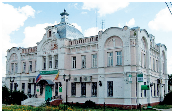
Рис. 6. Отделение Сбербанка. Ядрин. 2004 год

вянный паркет [3]. С 1999 года в особняке расположилось отделение Сбербанка (рис. 6).