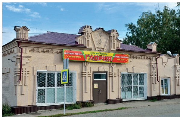
Рис. 10. Магазин. Одноэтажное каменное здание. Алатырь

Другой образец здания потребительской культуры города Алатырь — одноэтажное каменное здание, построенное как магазин и расположенное на улице Комсомола, 20 (рис. 10).