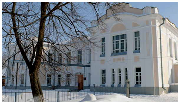
Рис. 8. Ядринский художественно-краеведческий музей. 2012 год

и филленчатые двери, и бетонная лестница с перилами. Сегодня в этом здании действует Ядринский художественно-краеведческий музей (улица Карла Маркса, 2) (рис. 8).