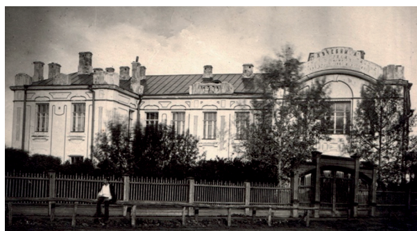
Рис. 7. Хирургическая и глазная лечебница. Ядрин. 1912 год