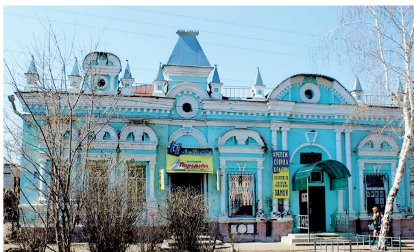
Рис. 9. Одноэтажное кирпичное здание хлебного магазина. Алатырь. 2015 год

Примером потребительской культуры служат здания конца XIX – начала XX века в городе Алатырь, которые использовались в качестве магазинов [8]. Одно из них — одноэтажное кирпичное здание — было построено как хлебный магазин (улица Ленина, 42) (рис. 9).