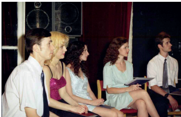
Первый выпуск театрального факультета (1997 год).