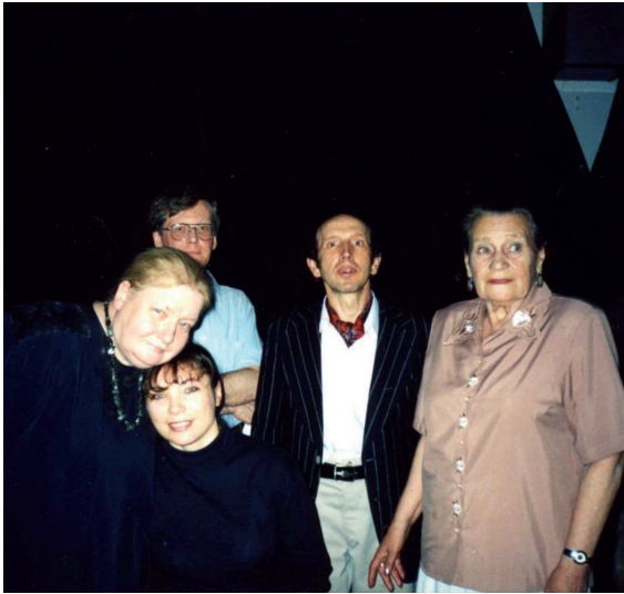
Первый выпуск специализации «артист театра кукол» (1998 год).