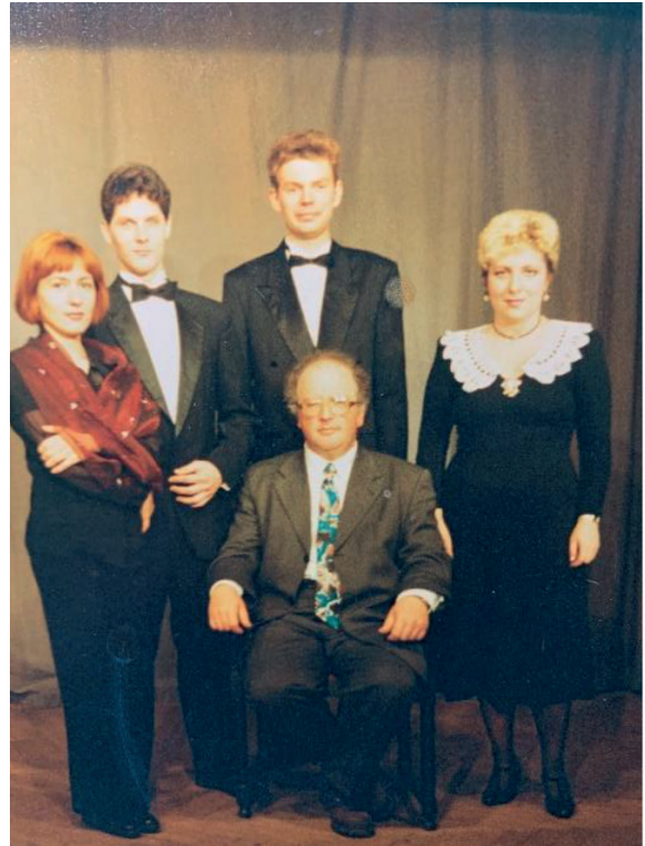
Первый выпуск специализации «артист эстрады». (2000 год).